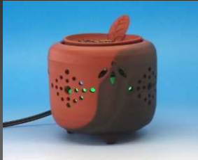
玉山窯元 MCAL100GZ1 陶芸家 中静勝昭