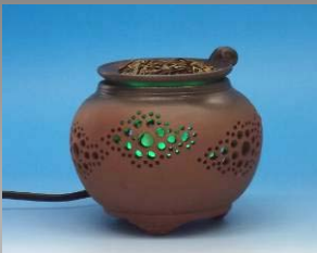
玉堂窯元 MCAL100G 陶芸家 細野利夫 23,100円(税込)