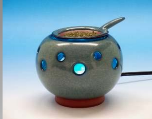
文平窯元 MCAL100B2 陶芸家 清水謙 25,200円(税込)