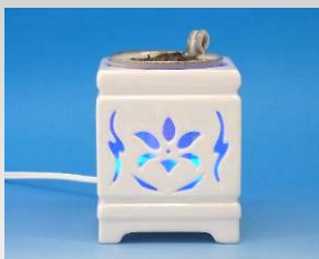
玉堂窯元 MCAL100C-H 陶芸家 細野利夫 22,500円(税込)