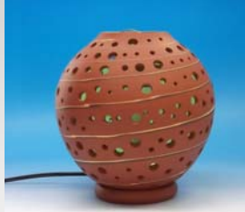
永柳陶房 MCAL100N 陶芸家 永柳修一 126,000円(税込)