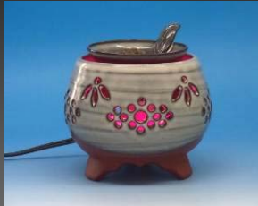
玉山窯元 MCAL10GZ2 陶芸家 中静勝昭 29,400円(税込)